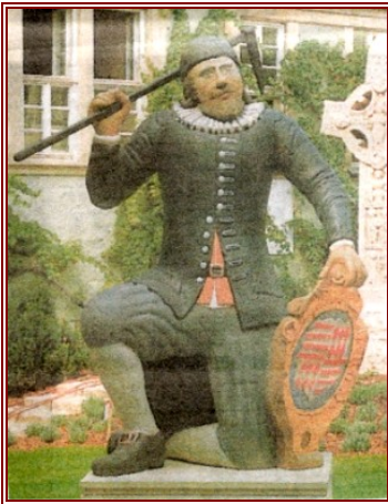
Kamerad Martin 1994 im Innenhof des Knauf Museums in Iphofen