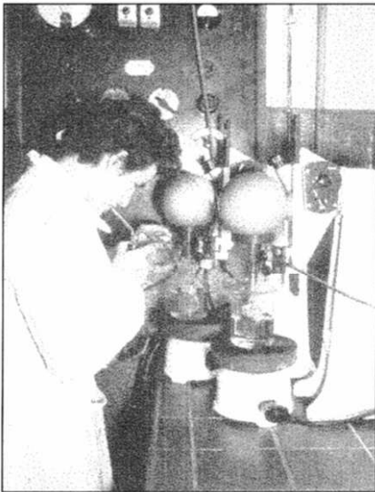
Elektrolytische Kupferanalyse im Zentrallabor

Im Ergebnis dieser technischen Veränderungen näherte sich die Häufigkeitsverteilung der Kupfergehaltsbestimmungen der durch ihren arithmetischen Mittelwert als besten Schätzwert repräsentierten Gaußnormalen. Auch die Analysenwerte der von vornherein mit automatischer Probenahme aus dem Gutstrom einer Bandübergabe ausgerüsteten Sangerhäuser Schächte zeigten diese Verteilung. Die Kappung der Analysenwerte der Berge- und Fäulebemusterung konnte zwischen IV/59 und I/61 schrittweise entfallen. Die "Probenahmedifferenz" zwischen Kupferinhalt Minerndurchsatz (100 %) und Kupferinhalt Rohstein (85 %), Theißenschlamm (0,5 %), Schlacke (7,5 %) und Eisen (1,6 %) sank 1959 auf 9,2 %, 1960 auf 7,48 %, 1961 auf 7,29 % und 1962 auf 5,7 %.