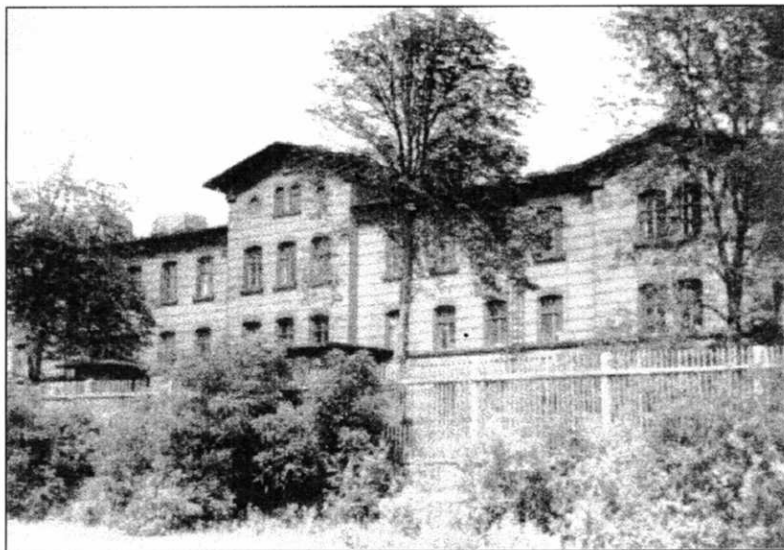
Zentrallabor um 1960

Daneben waren jedoch auch objektive Fehlerquellen erkennbar. Die Häufigkeit der Analysenwerte eines Probendurchganges über den Gehaltsklassen zeigt keine symmetrische Gaußnormale, sondern eine asymmetrische, linkssteile binomische Häufigkeitsverteilung. Deren statistische Auswertung nach De Wijs belegte die Überbewertung des „wahren“ Durchschnittswertes durch den arithmetischen Mittelwert vor allem bei Dachbergen und Fäule. Diese enthielten 1959 bei 22,8 % an Minernmüller lt. Bemusterung der Schächte 10,2 % von dem Kupferinhalt. Ab 1/1959 wurden die bergbauseitig ermittelten Kupferwerte für Dachberge und Fäule um 10 - 35 %, im Mittel um 18,7 % gekappt, was ca. 2 % der "Probenahmedifferenz" entsprach.