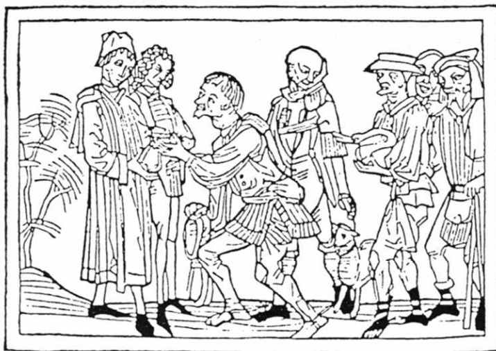
Ablieferung des Zehnten, Holzschnitt aus "Der Spiegel des menschlichen Lebens" Augsburg, H. Bäumlner 1479

Er wurde beispielsweise aus Erträgen der Landwirtschaft und auch des Bergbaues an den Landesherrn, aber auch an die Kirchen und an Bedürftige gezahlt.