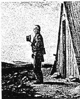
Romantik: Betender Bergmann vor der Kaue

Die Beschwerde der Empfänger bei der Königlichen Regierung in Merseburg war erfolgreich, und es wurden in "Befugnis der exekutiven Eintreibung" die einbehaltenen rund 18 000 Taler den Begünstigten zur Verfügung gestellt. Mehrere Klagen der Gewerkschaft führten zu umfangreichen und über Jahre andauernden Prozessen in mehreren Instanzen, ohne eine Einigkeit erzielen zu können. Während in der Revisionsinstanz noch verhandelt wurde, erzielten die streitenden Parteien mit Ausnahme der Stadtgemeinde Mansfeld und des dortigen Gemeindegemeinderates im Jahre 1879 eine tragbare Übereinkunft. Brassert schreibt dazu: "Zwischen der Mansfelder Kupferschiefer bauenden Gewerkschaft und dem größten Teil der Empfänger des geistlichen Fünzigsten kam ein Vergleich zu Stande, nach welchem diese Abgabe durch eine einmalige Kapitalzahlung gänzlich abgelöst und in Folge dessen nicht nur den mancherlei Schwierigkeiten und Streitigkeiten, zu welchen der geistliche Fünzigste im Laufe der Jahrhunderte Anlaß gegeben hatte, ein Ende gemacht, sondern der Mansfelder Bergbau von einer dauernden Belastung befreit wurde".