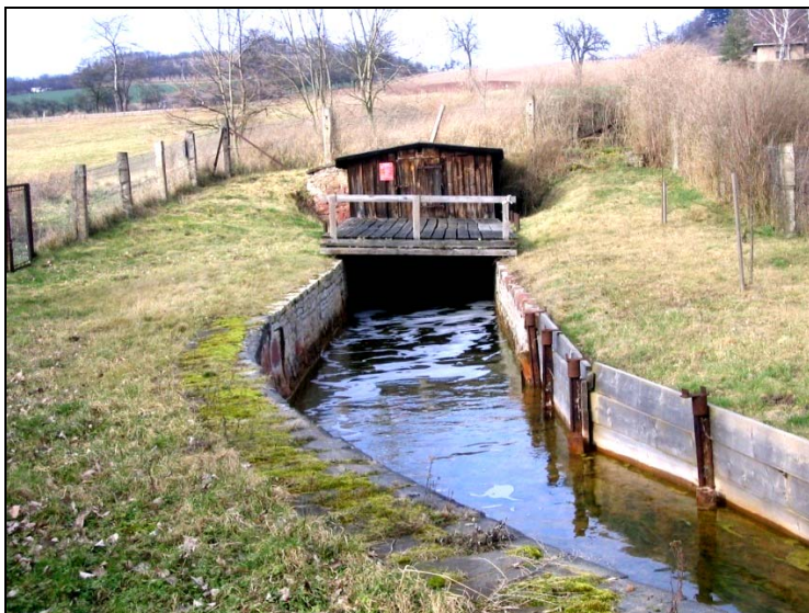
Abb.4: Mundloch des Schlüsselstollens

Erwähnenswert ist noch die Abflussentwicklung aus dem Schlüsselstollen, an dessen Mundloch nach wie vor salzige Wässer in der Größenordnung von 20 m 3 /min abfließen. Sie weisen aber im Gegensatz zu früher, wo bei Salzwasserabflüssen von ca. 40 m 3 /min ständig um die 100 kg Salz pro Sekunde abgegeben wurden, nur noch Werte um 8 - 10 kg Salz pro Sekunde auf. Dieser Wert wird uns ebenso wie der Abfluss aus dem Schlüssel- und den anderen noch aktiven Stollen des ehemaligen Kupferbergbaus praktisch ewig erhalten bleiben. Als Beispiel dafür soll für die Mansfelder Mulde der Schlüsselstollen genannt sein (Abb. 4: sein Mundloch).