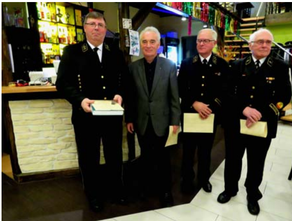
Herzlichen Glückwunsch, Dank und Anerkennung den für hervorragende Leistungen ausgezeichneten Mitgliedern