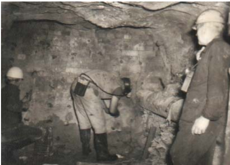
Abb. 1: Sprengung des Ritzdammes

Die Flutung begann am 01.07.1970 mit der Sprengung eines Ritzdammes in der 7. Sohle des Fortschrittschachtes 1 (Abb. 1 vor, Abb. 2 nach der Sprengung).