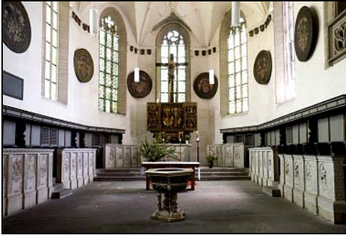
Der 1516 fertiggestellte Chorraum der St. Annenkirche

Kein Geringerer als der spätere Kardinal Albrecht, damals noch Erzbischof von Magdeburg und Halberstadt und dann auch von Mainz, weihte am 13. Januar 1516 den Chorraum unserer St. Annenkirche, der Kirche für die Berg- und Hüttenleute der Eisleber Neustadt.