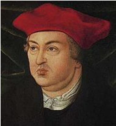
Kardinal Albrecht von Brandenburg Nach einem Gemälde von Lucas Cranach d. Ä.

Die auf Pergament geschriebene Einweihungsurkunde von 1516 in lateinischer Sprache und die deutsche Übersetzung konnten wir den interessierten Gästen zeigen. Erwähnt werden auf der Urkunde der noch heute im Chorraum stehende Hochaltar und das kurz vor seiner Einweihung stehende benachbarte Kloster der Eremiten-Brüder vom Orden des heiligen Augustin. Erzbischof Albrecht (lateinisch Albertus) erwähnt auf der Urkunde, dass er sich im 2. Jahr seines Pontifikats der Mutterkirchen und im 26. Lebensjahr befand.