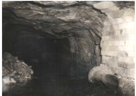
Abb. 2: Ritzdamm nach der Sprengung

Von diesem Zeitpunkt an flossen rund 40 m 3 /min oder fast 60.000 m 3 /Tag in Richtung der 14. Sohle. Damit erreichte der Anstau nach Überstau der 7. Sohle noch 1971 die 5. Sohle, im Jahr 1974 die 3. Sohle und 1981 das Niveau des Schlüsselstollens und damit nach 11 Jahren das Ende der Flutung (Abb. 3).