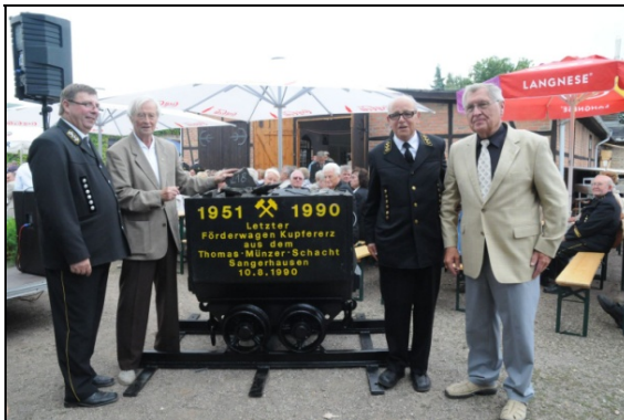
Der letzte Förderwagen mit Erz aus dem Schacht „Thomas Münzer“

Seien Sie gewiss, dass die Regierung der DDR die mit der Schließung der Mansfelder Schächte entstehenden Probleme sehr ernst nimmt und eine für alle Seiten annehmbare Lösung finden wird.“