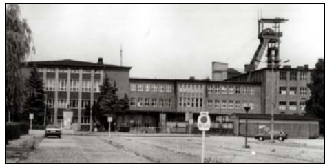
Bernard-Koenen-Schacht 1989 (Teufbeginn 1952, Endteufe 692 m, Produktionszeit 1958-1990)