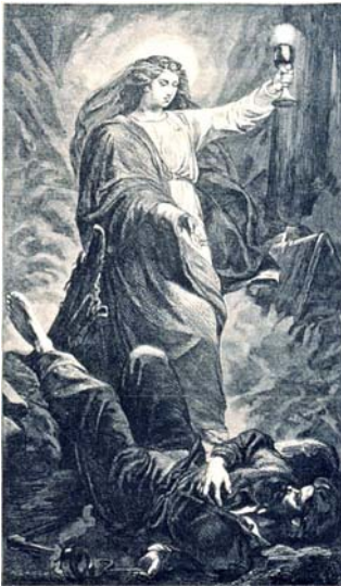
Heilige Barbara – einem Verunglückten die Hand reichend

das Jahr 2014 neigt sich dem Ende zu. Die Zeit der vorweihnachtlichen Veranstaltungen steht vor uns. Deshalb ergeht mit dieser Vereinsmitteilung die Einladung für unsere gemeinsame Barbarafeier mit dem Traditionsverein der Bergschule Eisleben. Aber auch die Mettenschicht am 16.12.2014 sollte Anlass sein, mit einer hohen Beteiligung die tiefe Kameradschaft unserer Vereinsmitglieder zum Ausdruck zu bringen.