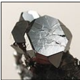
Sperrylith aus der Talnakh Cu-Ni-Lagerstätte bei Norilsk, Ostsibirien, Russland

Seit Anfang des 19. Jahrhunderts sind die bedeutendsten Platin- und Palladiummengen aus Nickelmagnetkies und Pentlandit sowie aus Flussschieferlagerstätten in Kanada (Sudbury), Südafrika (Bushveld), Russland (Norilsk, Pechenga) und Kolumbien gefördert worden.