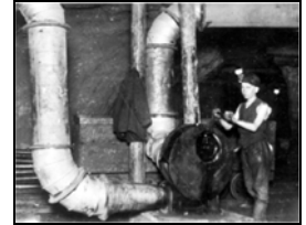
Der Junge am Handlüfter