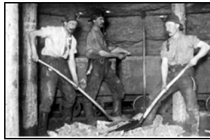
Das Füllen der Förderwagen