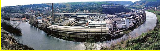
Draht- und Seilwerk Rothenburg

9.00 Uhr Treffpunkt: Mundloch des Schlüsselstollens zwischen Adendorf und Friedeburg Neumühle an der L 158 (s. Karte)