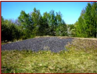
Halde im Hüttengrund

Der Vorstand wurde vom Sportverein Aufbau Eisleben, Sektion Wandern und Touristik, gebeten Informationsmaterial für eine Wanderung durch den Hüttengrund zur Verfügung zu stellen. Nebenstehendes Dankschreiben ging von der Sektionsleiterin ein (gekürzt).