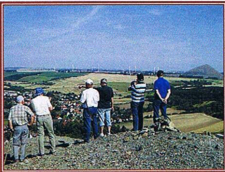
Auf der Halde des Wolf-Schachtes Blick ins Mansfelder Land

Der Vorstand empfiehlt, dass der Verein diese neue Initiative auch im Hinblick auf die im nächsten Jahr anstehenden Inbetriebnahmejubiläen unserer Rohhütten unterstützt. Des Weiteren schlägt der Vorstand vor, die Halden des Wolf- und Clotilde-Schachtes für ein touristisches Angebot zu erschließen. Um diese Vorschläge zu konkretisieren, unternahmen die Mitglieder des Vorstandes am 6. Juli entsprechende Haldenbefahrungen.