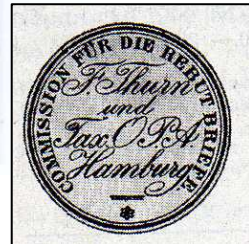
Briefverschlussmarke der Post in Hamburg 1852/65