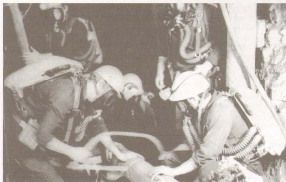
Eine Gruppe der Grubenwehr während einer Übung

Heute ist das gesamte Grubenfeld des Reviers Sangerhausen verwahrt und geflutet und nur noch das Fördergerüst in Nienstedt ist sichtbares Zeugnis des einstigen Bergbaus. Vergessen sind dieses Ereignis und seine Opfer aber keineswegs.